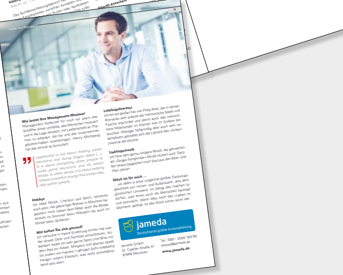
Beispiele letzter Ausgaben